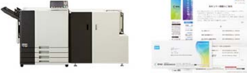
メーリングフィニッシャーモデル