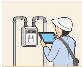
電気・ガス・水道の検針や点検に