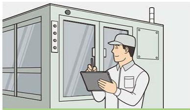
工場検査装置の点検に