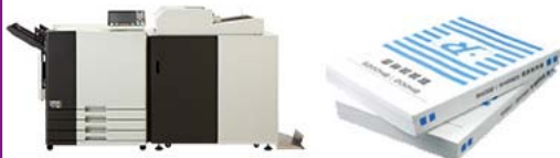
くるみ製本フィニッシャーモデル