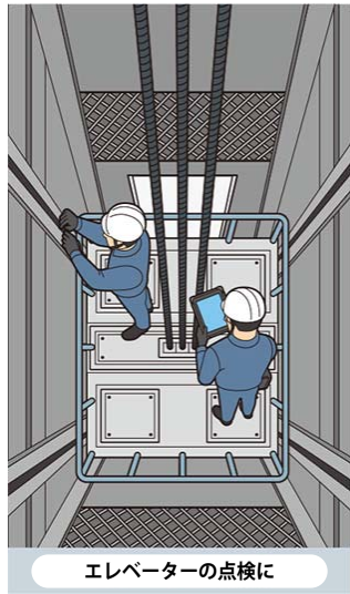
エレベーターの点検に