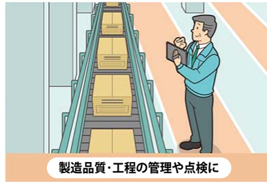
製造品質・工程の管理や点検に