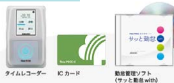
タイムレコーダー ICカード 勤怠管理ソフト (サッと勤怠 with)

最初に自社の勤務パターン等を登録しておけば、あつというまにソフトが集計し、勤怠管理が驚くほどスピーディーに。すぐに使えるオールインワン