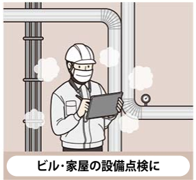
ビル・家屋の設備点検に