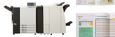
マルチフィニッシャーモデル