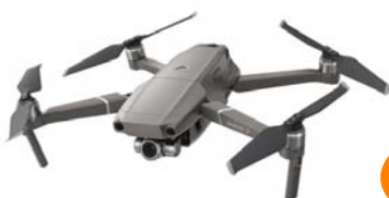
Mavic 2 Pro / Mavic 2 Zoom

ドローンの活躍分野はますます拡大を見せており、ビジネスの現場ではさまざまな活用がされています。例えば、災害時の活用一つとっても、被害状況や危険箇所の確認、遭難者の捜索、避難指示、物資の運搬など、ドローンの役割が一気に広がります。ドローンで限界を超え、業務の可能性を広げてみませんか。